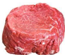
Μικρά κομμάτια (π.χ. φιλέτο)

Λειτουργία και των δύο καυστήρων με την ίδια θερμοκρασία: