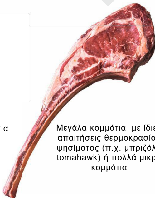
Μεγάλα κομμάτια με ίδιες απαιτήσεις θερμοκρασίας ψησίματος (π.χ. μπριζόλα tomahawk) ή πολλά μικρά κομμάτια

Λειτουργία και των δύο καυστήρων με διαφορετικές θερμοκρασίες: