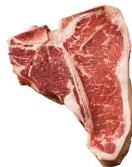
Μεγάλα κομμάτια με διαφορετικές απαιτήσεις θερμοκρασίας ψησίματος (π.χ. μπριζόλες T-bone ή Porter-house)