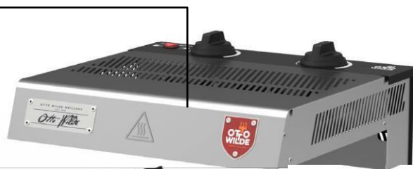
E-O.F.B. Πάνω μέρος

Εάν αγοράσατε κατά λάθος το πάνω μέρος από το ηλεκτρικό Otto Wilde Grillers O.F.B χωρίς το αντίστοιχο κάτω μέρος, επικοινωνήστε με την εξυπηρέτηση πελατών μας.